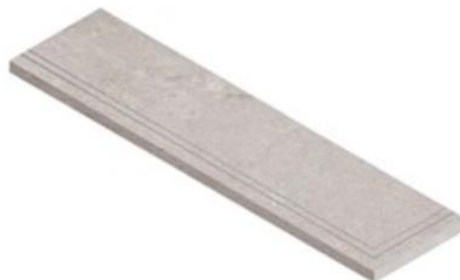
STEP EXTRA THICK CORNER INOX * 30X120 NR / TC

*) porraslaatat saatavissa sekä vasen- että oikeakätisenä