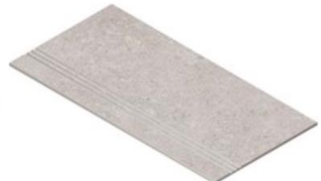
STEP TREAD FLUTED 45X90 NR / TC