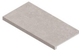
STEP EXTRA THICK 30X60 NR / TC /