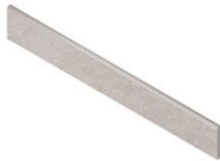
SKIRTING 8X60 NR / TC