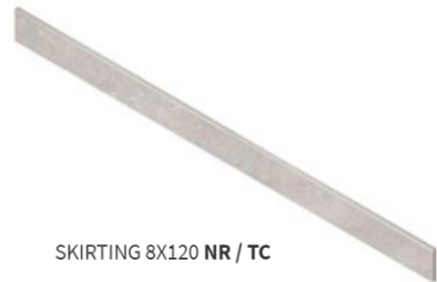
SKIRTING 8X120 NR / TC