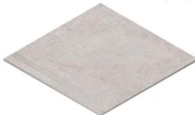
DEGRAU SULCADO 60X60 NR / TC /