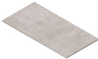
STEP TREAD FLUTED 30X60 NR / TC /