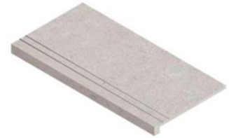
STEP EXTRA THICK INOX 30X60 NR / TC /