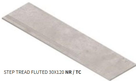
STEP TREAD FLUTED 30X120 NR / TC