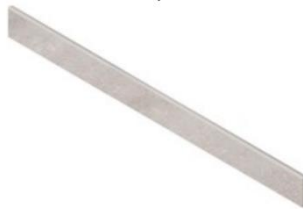
SKIRTING 8X90 NR / TC