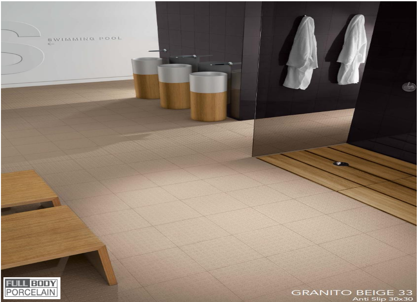
GRANITO BEIGE 33 Anti Slip 30x30